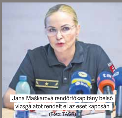
Jana Maškarová rendőrfőkapitány belső vizsgálatot rendelt el az eset kapcsán

Tizenegy nappal később a férfi megjelent a hétvégi háznál, ahol az asszony tartózkodott és megkéselte, majd egy kocsival elmene-kült. A rendőrség őrizetbe vette, az áldozaton azonban már nem tudtak segíteni. Az eset általános sokkot okozott a településen.