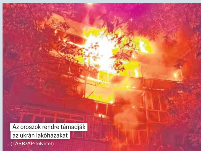
Az oroszok rendre támadják az ukrán lakóházakat