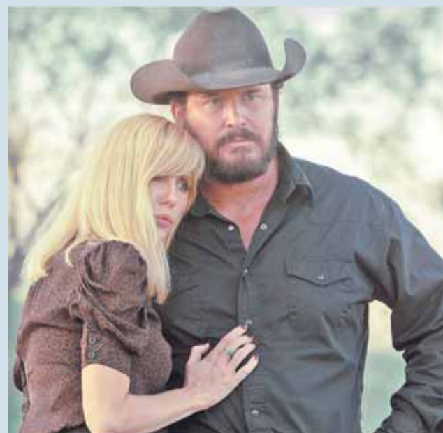
Beth Dutton és a férje, Rip Wheeler (Kelly Reilly és Cole Hauser) magamögött hagyta Montanát

de kegyetlen tájak adagolják a jót a nézőknek: a Dutton birtok semmi forradalmival, vagy akár csak kicsit újszerűvel sem próbálkozik, de a modern westernes családregegyvonalat ügyesen viszi. Hitelesítő elemnek pedig ott van a helyi állatorvos szerepében rutinból brillírozó Ed Harris, akinek a ráncai gyönyörűbbek, mint a tengerparti nyári naplemente bárhol. A nehézsúlyú sztárok képesek súlyt adni a rutinból vezetett történetnek, az idilli Amerika-ábrázolás pedig talán klisé, de legalább valóban ihletett és szemet gyönyörködtető.