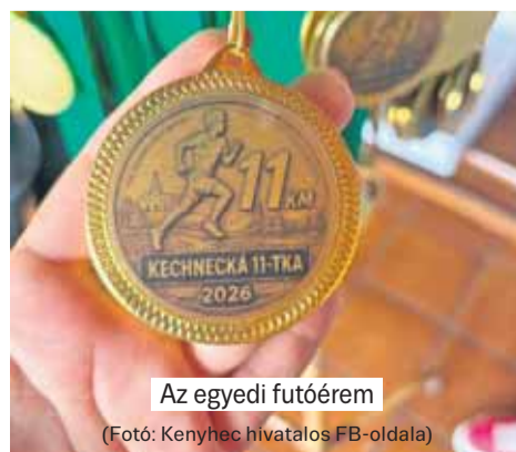
Az egyedi futóérem