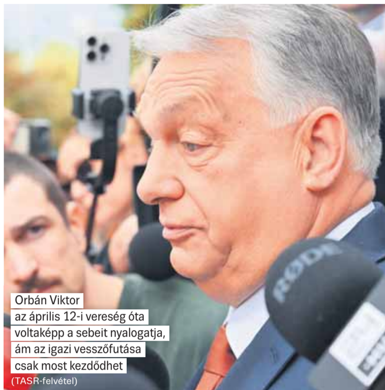
Orbán Viktor az április 12-i vereség óta voltaképp a sebeit nyalogatja, ám az igazi vesszőfutása csak most kezdődhet

Orbán Viktor utasítására foghatják el a magyar hatóságok az ukrán pénzzállítókat – erről beszélt Laczó Adrienn egykori bíró, az ukrán pénzzállítók ügyvédje. Laczó szerint ha ez bebizonyosodik, könnyen megállhat Orbán Viktor bün-