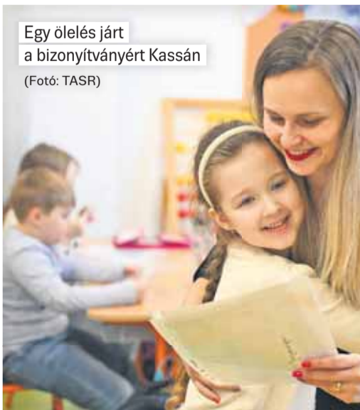
Egy ölelés járt a bizonyítványért Kassán

nem –, valamint egyéb szervezési és működtetési okokkal indokolják az iskolák. Összesen 749 091 tanuló és diák veszi át az év végi bizonyítványát, a speciális iskolákat is beleértve. Közülük 522 022 alapiskolás, 227 069-en pedig középiskolások. 61 757 kiselsős most kapja meg az első bizonyítványát. A 2025/2026-os tanévben az oktatási minisztérium adatai szerint 68 630 tanár dolgozott az alap- és középiskolákban. „A nyári szünetben a pedagógusok a Munka törvénykönyve szerint járó szabadságukat töltik, de a szünet egy részét az új tanév előkészítésére, képzésekre, papírmunkára és az iskola működésével kapcsolatos teendőkre fordítják” – tette hozzá a tárca. (TASR)