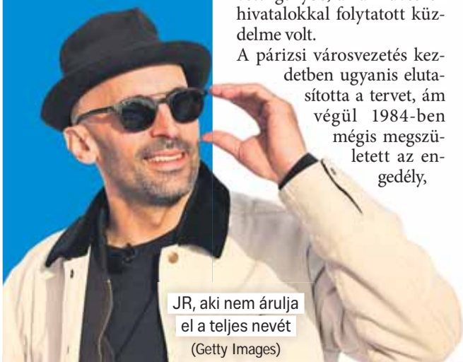
JR, aki nem árulja el a teljes nevét

Amikor belépünk a barlangba, nem látjuk a kijáratot. Végig kell járnunk az utat a forrásainkhoz, az eredetünkhöz, hogy aztán újra megpillanthassuk a fényt – fogalmazott JR egy interjúban.