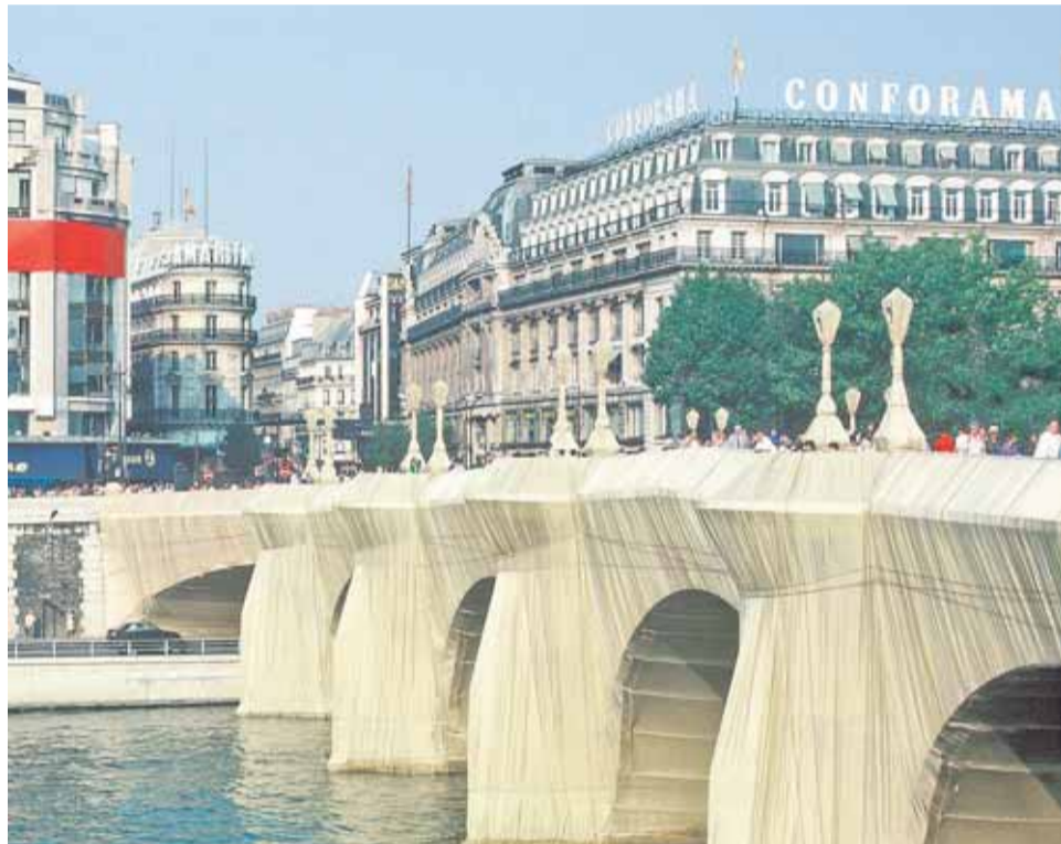
A Pont Neuf 1985 szeptemberében (CC BY-SA 4.0)

A párizsi városvezetés kezdetben ugyanis elutasította a tervet, ám végül 1984-ben mégis megszületett az engedély,