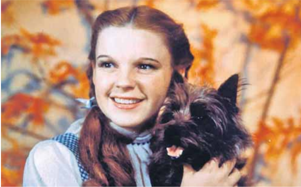
Judy Garland alakította Dorothy karakterét az 1939-es klasszikus filmben

Tudta, hogy léteznek olyan cipők, amelyek árából akár egy magán-szigetet, luxusjachtot vagy több kisebb kastélyt is vásárolhatna? Ráadásul nem is igazán hordhatók.