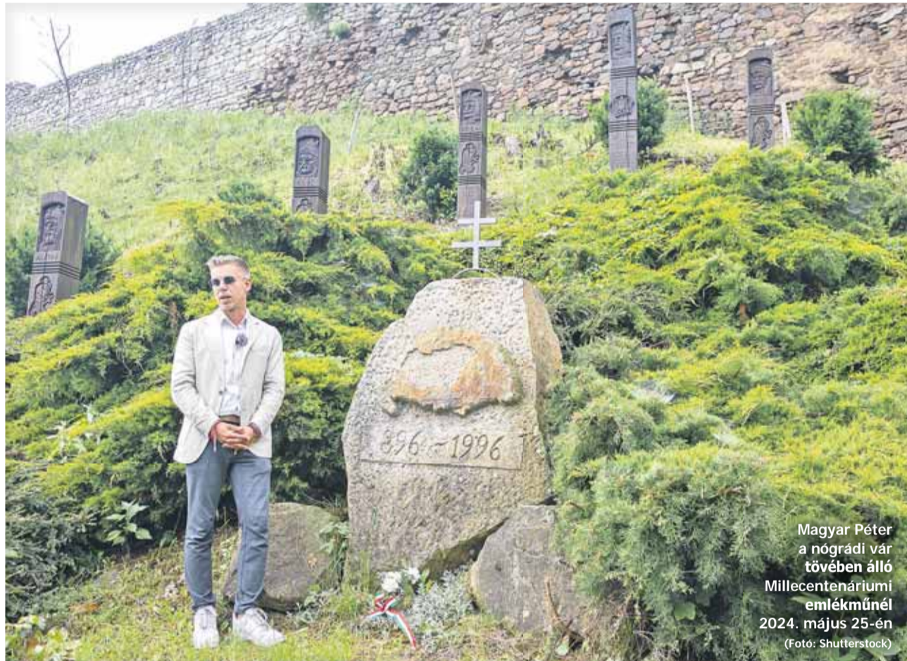
Magyar Péter a nógrádi vár tövében álló Millecentenárium emlékműnél 2024. május 25-én

Megjegyzések Bárdi Nándor magyar–magyar viszonyról szóló írásaihoz