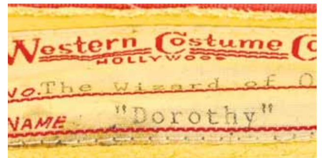
Az eredeti jelölések ma is láthatók a legendás cipőkön

drágább cipői nem gyémántokkal kirakott luxusdarabok. Nem egy királynő vagy divatikon tulajdonában álltak, és az alapanyaguk sem ér különösebb vagyont.