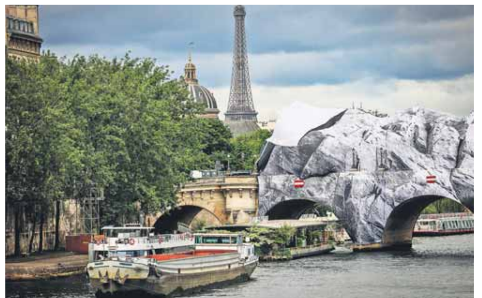
Mielőtt megnyitották volna, a szél erősen megrongálta az alkotást