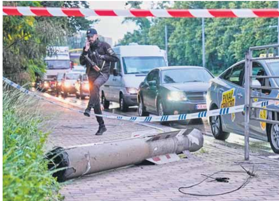
Rakéta maradványai egy kijevi utcán az ukrán fővárost ért orosz támadás után, 2026. június 15-én

Úgy gondolom, hogy a donbázi erődvonalat az idén biztosan nem fogják tudják tudni elfoglalni az oroszok. Konsztantynivkát valószínűleg igen, mert a fele már a kezükben van, az ukránok teljesen fölöslegesen hagyják bent az embereiket a város közepén. Kérdés, hogy meddig vannak az oroszoknak olyan embereik, akiket be tudnak