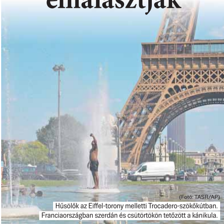
Hűsölők az Eiffel-torony melletti Trocadero-szökőkútban. Franciaországban szerdán és csütörtökön tetőzött a kánikula.