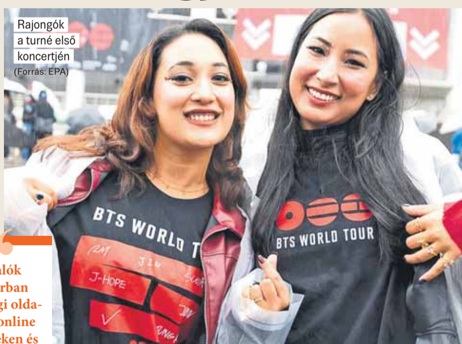
Rajongók a turné első koncertjén

A csapat márciusban megjelent Arirang című albumát egy 88 állomásos koncertsorozattal népszerűsíti. A BBC beszámolója szerint a BTS-koncertek iránti kereslet messze meghaladja a kínálatot: egy-egy elérhető jegyre átlagosan 15 vásárló jut. A turné több állomásán percek alatt elfogytak a jegyek, és bár a szervezők néha bejelentenek egy-két új időpontot, a koncertek száma vélhetően nem emelkedik jelentősen – már csak a fiúkra nehezedő komoly fizikai terhelés miatt sem. Nemrég Jakartában és a Fülöp-szigeteki Bulacanban is harmadik koncertet adtak hozzá a programhoz. Májusban Mexikóban viszont nem iktattak be pluszfellépéseket, dacára annak, hogy az ottani államfő levélben kérte erre a dél-koreai államfőt. A jegyekért folyó versenyből jelenleg a bűnözők profitálnak. Délkelet-Ázsiában a rajongók már több mint 120 ezer eurónak megfelelő összeget ve-