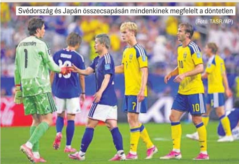
Svédország és Japán összecsapásán mindkét félnek megfelelt a döntetlen

négyen is négy ponttal lettek csoportharmadikok – azaz váratlanul „erős” a csoportharmadikok tabellája. Skócia továbbjutási esélyei így 13,4%-ra zuhantak (megj.: az újabb csoportok lezárulásával természetesen ez a szám megugorhat, vagy tovább csökkenhet.)