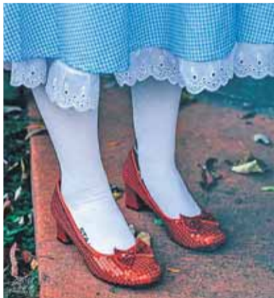
A legendás vörös cipellők több mint 28 millió dollárért kelttek el egy árverésen

bemutatott filmben Judy Garland viselte. A lábbelik 2024-ben elképesztő összegért, 28 millió dollárért kelttek el egy árverésen. Az aukciós jutalékokkal együtt a végső ár elérte a 32,5 millió dollárt. Az ismeretlen vásárló azonban nem csupán egy filmes relikviát szerzett meg, hanem egy rendkívüli történet részévé is vált. A ci-