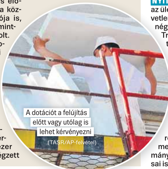
A dotációt a felújítás előtt vagy utólag is lehet kérni (TASR/AP-felvétele)

közbeszerzésnek köszönhetően, amelybe több intézmény is bekapcsolódott, a korábbi időszakhoz képest jelentősen sikerült csökkenteni az energia beszerzési árát is” – közölte a városi hivatal. (vp)