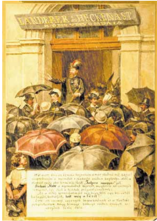
Barabás Miklós: Jókai Mór március 15-én

Karácsonykor a felesége hamis útlevelel Pestre vitte. Bár