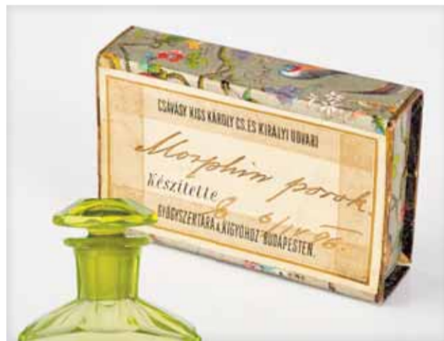
Gyógyszerdoboz – a budapesti Kígyó Patika számára, 1890 körül, Magyarország