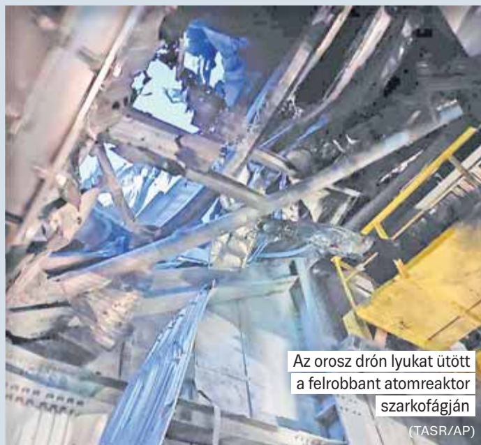
Az orosz drón lyukat ütött a felrobbant atomreaktor szarkofágján

ban meglepetéssel is várták. A tárgyalás helyszínül szolgáló szobában ugyanis a lelőtt drón maradványai várták a nagykövetet. Ozerovot váratlanul érte a látvány, kibillent a szerepéből. A moldávok tájékoztatták Ozerovot, az incidenst szuverenitásuk megsértésének tekintik, ezért válaszlépésként bezárják az orosz állami támogatásból működő moldovai orosz kulturális ügynökséget. Maia Sandu moldovai elnök szerint két Sahed/Geran kamikazedrón az ország területén belül csapódott be. (MTI, 444)