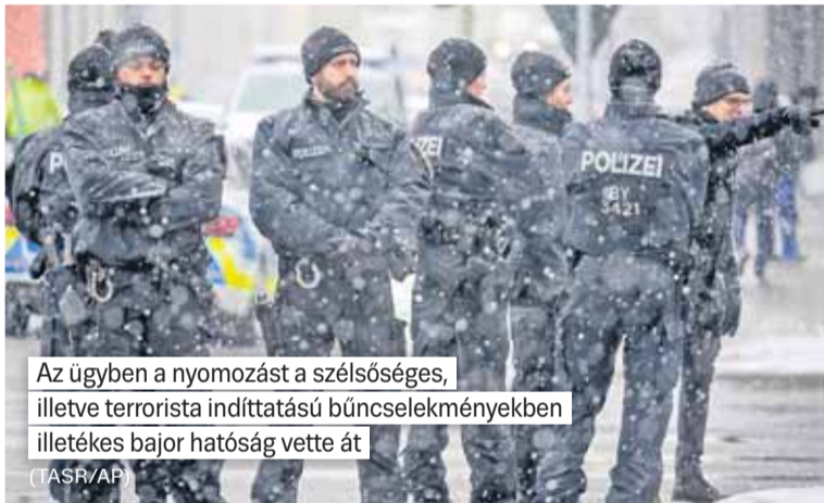
Az ügyben a nyomozást a szélsőséges, illetve terrorista indíttatású bűncselekményekben illetékes bajor hatóság vette át