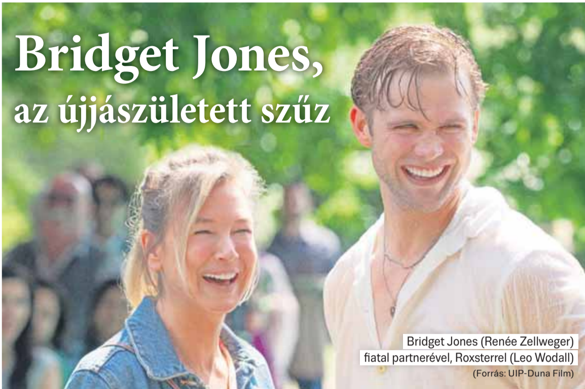
Bridget Jones (Renée Zellweger) fiatal partnerével, Roxsterrel (Leo Woodall)