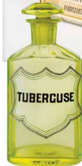
Gyógyszertári palack dugóval – „Tubercuse” felirattal, 1900 körül, Csehország (feltehetően)