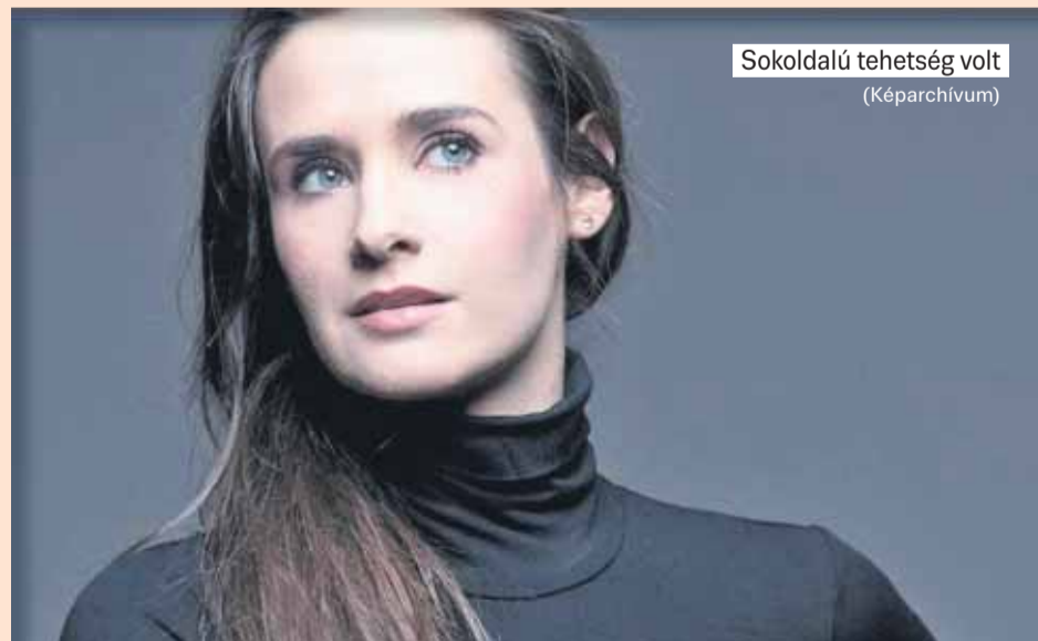
Sokoldalú tehetség volt