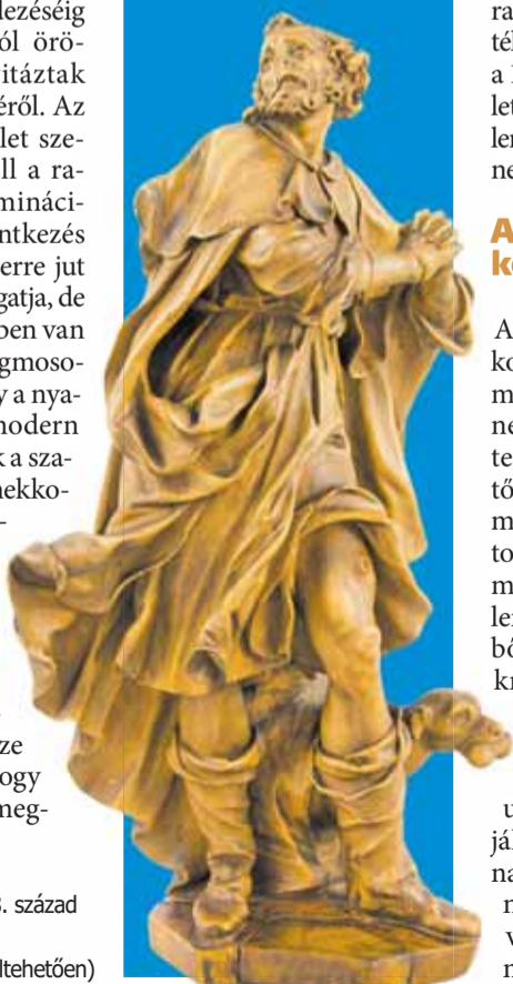
Szobor – Szent Rókus, 18. század közepe, Dél-Németország (feltehetően); Ausztria (feltehetően)

A következő négy évszázadban szinte évtizedenként felbukkanó döghalál újabb és újabb óvintézkedésekre sarkallta a városokat: a karantén intézménye is ezek közé tartozott, amelyhez a lepra kezelésének tanulságai, a városokon kívülre telepített kórházak (leprozóriumok) adták az alapötletet.