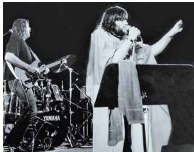
Hobo magyar és román zászlósból összevert palástot is viselt az 1990. március 5-i fellépésén