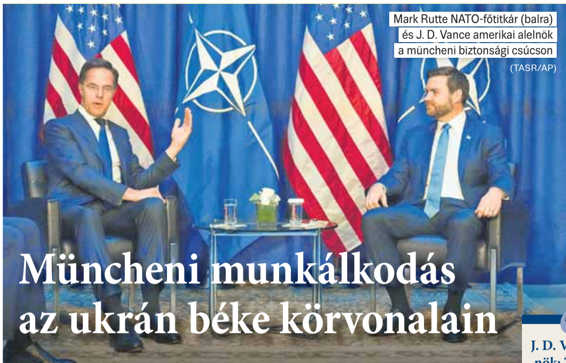
Mark Rutte NATO-főtitkár (balra) és J. D. Vance amerikai alelnök a müncheni biztonsági csúcson