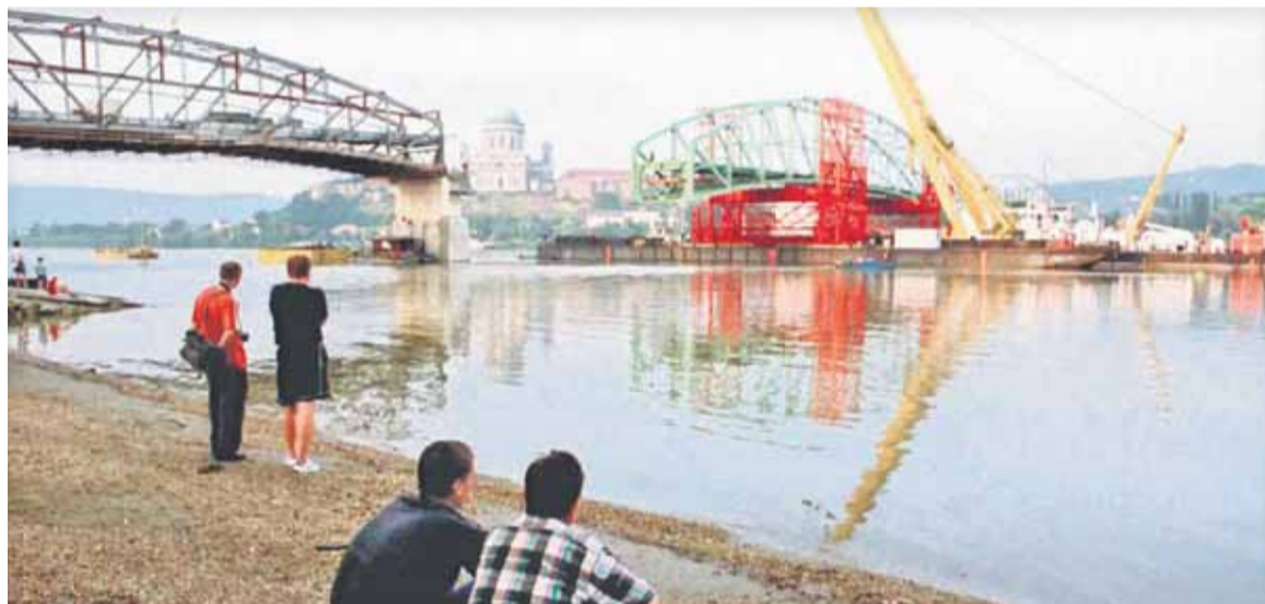
A híd újjáépítési munkálatait 2000-ben kezdték, majd egy évvel később átadták az építményt

A robbanás következtében három belső hidnyílás megsemmisült és a híd két pillére is súlyosan megsérült. A következő hónapokban katonai pontonhíd kötötte össze a két partot, de 1945 októberében a szovjet katonai parancsnokság utasítására ezt lebontották. A súlyosan megrongálódott pillér kijavítását és a hajózás biztonságát szolgáló villanyvilágítás kiépítését csak 1960–1962-ben végezték el. A magyar fél 1945-ben dolgozta ki határkapcsolati tervét, de azt a csehszlovák fél elutasította. A híd további sorsát 1964-ben tárgyalta a magyar–csehszlovák közlekedési albizottság. Úgy döntöttek, hogy 1970 előtt egyik fél sem tervezi a híd helyreállítását.